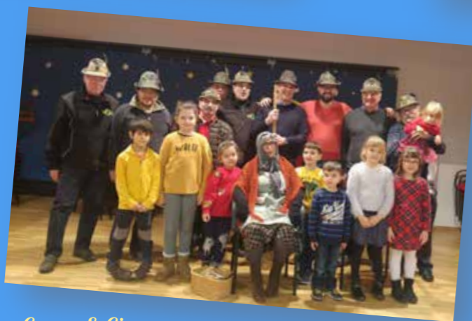
Gruppo S. Giacomo