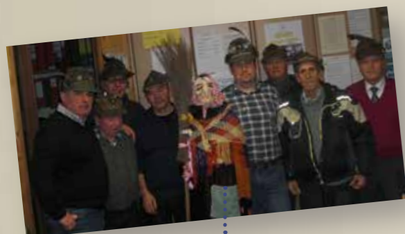
Gruppo Salerno e Pochi