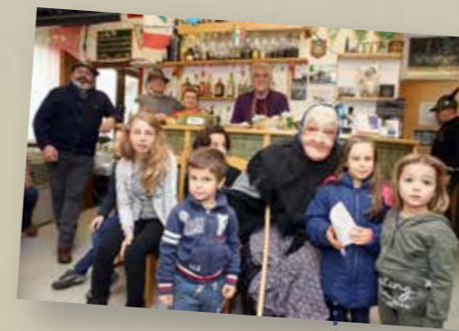
Gruppo S. Maurizio