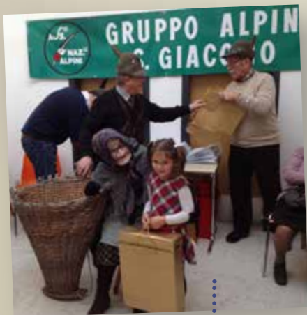
Gruppo S. Giacomo