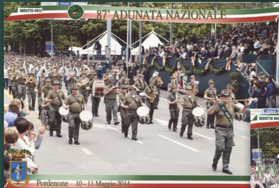
Pordenone 10 - 11 Maggio 2014

Le stesse ed altre sono prenotabili tramite Capogruppo presso la Sede Sezionale.