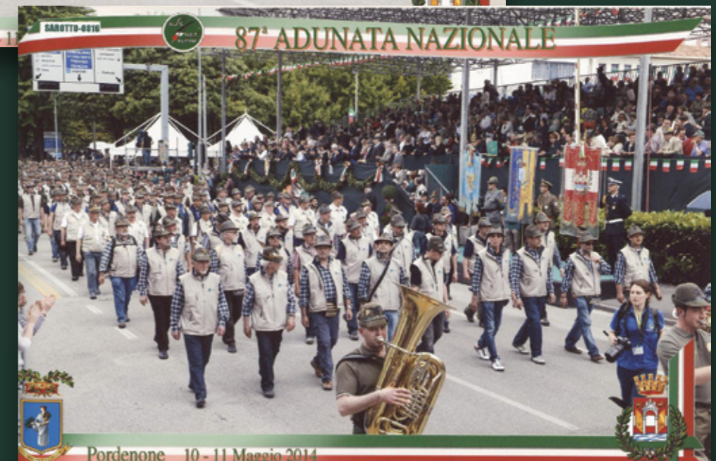
Pordenone 10 - 11 Maggio 2014

Non è facile parlare e soprattutto descrivere l'Adunata Nazionale. L'Adunata è un crogiolo di emozioni, di sorprese, di incontri, di feste, di partecipazione corale che pur ripetendosi da molti decenni non è mai simile alle altre. Ecco allora i ricordi, quel "io c'ero" espresso con l'orgoglio dei "vecchi" e lo stupore dei più giovani. Tutto questo, ancora una volta ed al di là delle doverose e belle cerimonie istituzionali, lo abbiamo visto e sentito anche a Pordenone, città e Sezione che per anni avevano auspicato l'agognata assegnazione. E sono stati bravi. Come sempre un bagno di folla, nel vero senso della parola, tanto da rendere problematico l'attraversamento della città fin dalla giornata di venerdì. Anche noi dell'Alto Adige non eravamo certamente in pochi, e, credo che si sia sfilato con una compattezza invidiabile. Non voglio fare la cronaca delle tre giornate che ognuno ha vissuto a modo suo e che i media hanno riportato, una volta tanto, con buona e positiva visibilità per la nostra Associazione. Lascio alle immagini fotografiche un quadro sufficiente dell'avvenimento. Il Presidente ed il Consiglio sezionale si complimentano con tutti i partecipanti e li ringraziano per la loro presenza, così come ringraziano la città di Pordenone, la bella sezione ed il Presidente Gasparet.