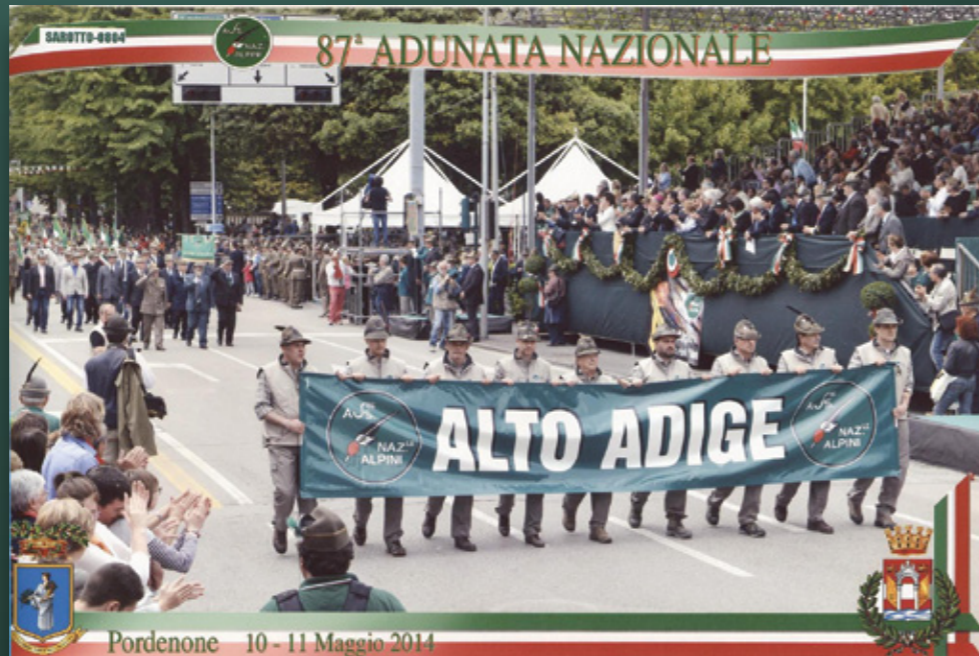
Pordenone 10 - 11 Maggio 2014