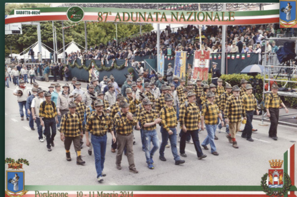
Pordenone 10 - 11 Maggio 2014