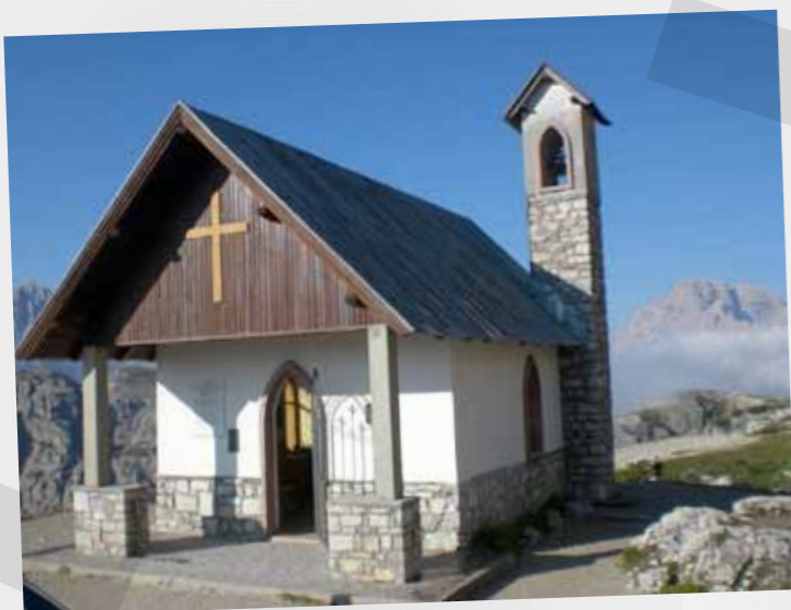
Bolzano, 23 gennaio 2014