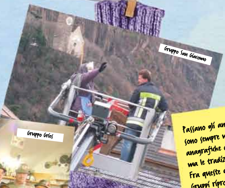
Gruppo San Giacomo

Passano gli anni, i piccoli, figli dei Soci sono sempre meno per evidenti ragioni anagrafiche degli iscritti, ma le tradizioni si mantengono vive. Fra queste quella della Befana che molti Gruppi ripropongono di anno in anno per la gioia dei più piccoli e per il piacere di ritrovarsi anche con le famiglie.