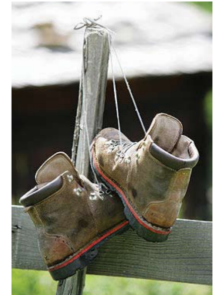
Scarpe Grosse Periodico della Sezione Alto Adige dell'Associazione Nazionale Alpini

Direttore Responsabile: GIANFRANCO LAZZERI