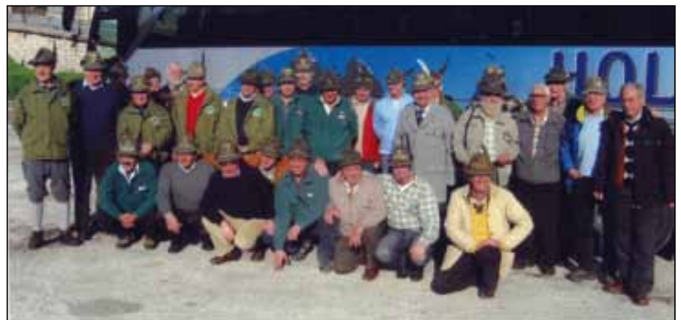
Gruppi A.N.A. di Brunico - Monguelfo - Dobbiaco - San Candido a Trento per la sfilata del " Triveneto " 09 nov. 2008