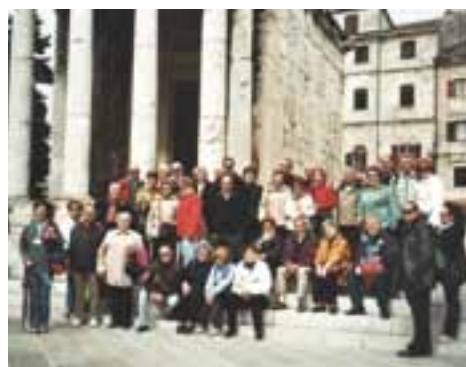
Foto ricordo di gruppo scattata ad Istria.