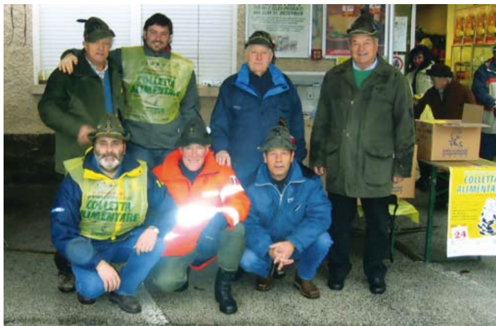
Una fase della raccolta effettuata ad Ora

Un gesto semplice, come quello di donare cibo ai poveri, è un gesto di condivisione del bisogno materiale dell'uomo di donare qualcosa agli altri. Grazie ancora a tutti.