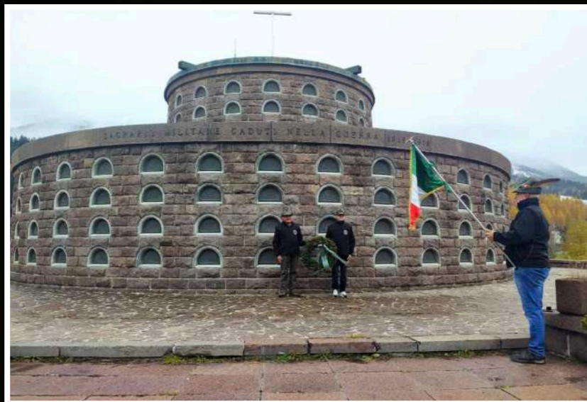
Gruppo San Candido