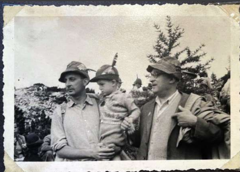
Ortigara, giugno 1950. Tre generazioni - nonno, figlio, nipote.