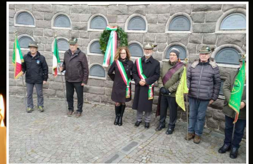
Gruppo Malles Venosta

Nella prima decade del mese di novembre, gli Alpini della Sezione, fedeli al motto: "Onora i morti aiutando i vivi", hanno voluto ricordare tutti i Caduti che hanno donato la propria vita nell'adempimento del proprio dovere.