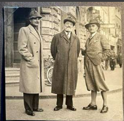
Adunata Nazionale 1949 (Alm. - Dr. Verrier - col Pascherini)